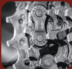
Samler ikke skitt