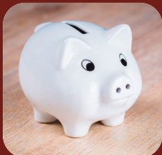
Sparer tid og penger